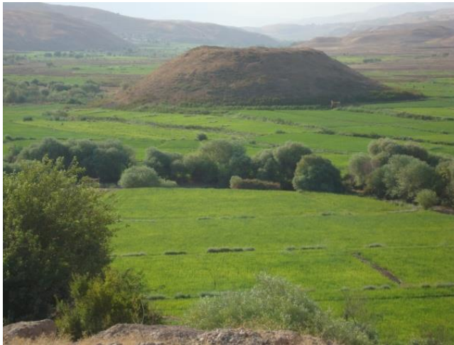
تل سیروان در دشت آباد سیروان

گردنه «مله گون» از کنار قلعه سنگی هیزدر ۸ به سمت نواحی ایلام فعلی ادامه می‌یابد. به نظر می‌رسد راه دیگری از دامنه غربی مله گون به سمت روستاهای طولاب ۹ و داروند ۱۰ از دهستان میش خاص ۱۱ (سرچشمه رود گل گُل)، وجود داشته که به سمت سنگ نوشته آشوری در شهرستان ملکشاهی و از آنجا به سوی منطقه باستانی کان گنبد امتداد یافته است. در این مسیر، آثاری وجود دارد که مهم ترین آن‌ها قلعه هیزدر، غارهای بره زرد ۱۲ و چهل ستون، سنگ نوشته دوره آشوری، قلعه ملکشاهی و قبرستان کان گنبد می‌باشند. این راه مهم در نهایت به مناطق بین النهرین متصل می‌شود.