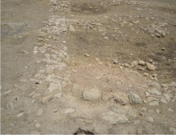
نمای سطحی تپه کلنانی، روستای