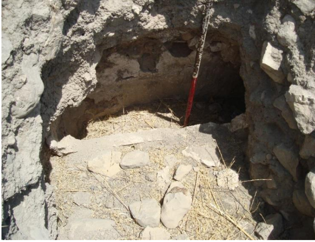
حفاری غیرمجاز تپه کلنانی، روستای درویشان