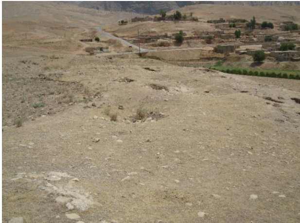
نمای محوطه و روستای فعلی درویشان

مصالح به کار رفته در بنا، سنگ لاشه و گچ می باشد. در ضلع غربی چهارطاقی محوطه نسبتاً وسیع سه پا قرار دارد که دارای اثر پی بناست. به نظر می رسد این مکان دژ و قلعه بوده باشد. حفاری غیرمجاز در چند نقطه اثر دیده می شود.