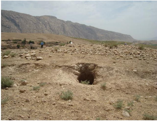
حفاری غیرمجاز مجموعه آثار کل سه پا درویشان