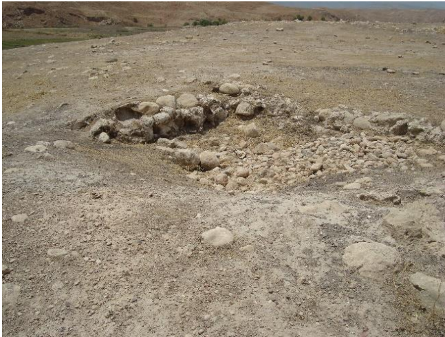
نمای کلی تپه کلنانی، روستای درویشان