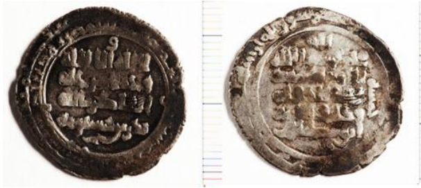
درهم نقره برزین حسویه ضرب السیروان (شماره اموال: ۵۱۱۲,۰۶,۰۰۹۸، موزه ملک).

به نام سراب کلان موسوم است. "البته، دومورگان در فاصله سال‌های ۱۸۹۳-۱۸۹۶ دره شهر و سیروان را بررسی کرده است. یعقوبی گوید: میان سیروان و صیمره دو مرحله است (یعقوبی ۲۵۳۶: ۴۴). و نیز گویند که سیروان قریه‌ای است به جبل (ابوالفداء ۱۳۴۹: ۴۷۹) تا قرن پنجم هجری جزو حکومت حسویه بوده و سکه‌های نقره‌ای در این شهر ضرب شده است.