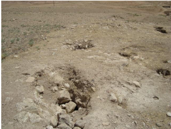
آثار ابنیه محوطه باستانی درویشان