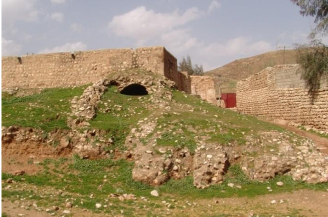
بقایای شهر سیروان