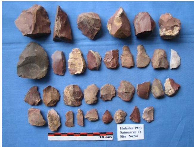
ابزارهای سنگی به دست آمده از ناحیه سیمره در دره هلیلان

اریک اشمیت، سال ۱۳۱۳ شمسی در منطقه، مطالعات باستان‌شناسی زیادی انجام داده است (کوچکی، ۱۳۹۱: ۱۲۸). "کلرگاف مید" بین سال‌های ۱۹۶۳م تا ۱۹۶۷م در نقشه‌ای که از محوطه‌های باستانی لرستان ارائه داده، از تپه‌های کزآباد، گوران و چشمه‌ماهی در منطقه هلیلان به عنوان محوطه‌های اصلی عصر برنز یاد کرده است. وی بعضی از آثار و سفال تپه‌های کزآباد را در زمرة آثار عصر آهن II و III تاریخ‌گذاری کرده است (همان: ۴۳). در دوره بعد، انسان علاوه بر تولید بخش مهمی از نیازهای غذایی، موفق شده با درست کردن سرپناه‌های ساده در معماری، قابلیت‌های فرهنگی خود را ظاهر سازد و با ایجاد روستاهای کوچک و موقت، روستاهای دائمی را پدید آورد و این‌گونه مقدمه‌ای بر شهرنشینی فراهم آید.