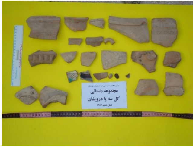
نمونه سفالینه و دیگر شواهد فرهنگی مجموعه آثار کل سه پا درویشان