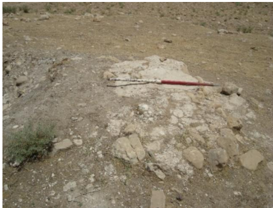
تصویر بخشی از سازه‌های سطحی مجموعه آثار کل سه پا درویشان

مجموعه آثار کل سه پا درویشان در منطقه جنوبی شهر لومار واقع شده است. این مکان باستانی ۷۹۸ متر از سطح دریا ارتفاع دارد. ارتفاعات سیوان و قله معروف قلارنگ با فاصله دورتری نسبت به سایر مناطق سیروان در غرب این منطقه امتداد دارد. شهر لومار در این محدوده جغرافیائی واقع شده است. نزدیکی به ارتفاعات، دشت حاصلخیز، منابع آب و اقلیم معتدل این محدوده جغرافیایی از عوامل عمده سکونت و استقرار جمعیت در این شهر باستانی بوده است. این محوطه از نظر توپوگرافی نسبتاً هموار و زیرساخت طبیعی آن رس - شنی است.