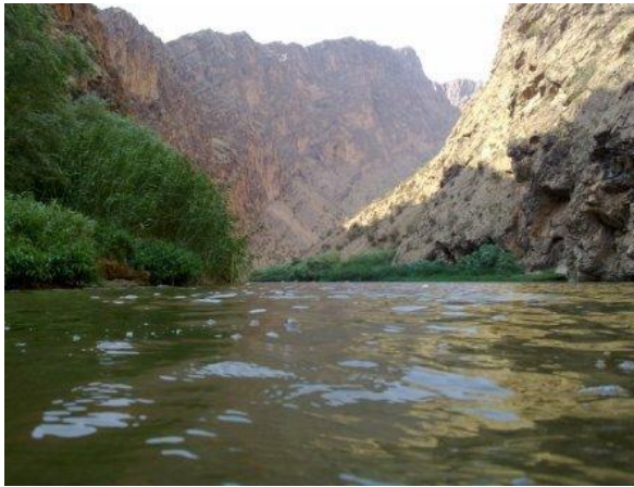
تنگ سازوین از جاذبه‌های طبیعی سیروان

سیروان سرچشمه گرفته و در جهت غرب به شرق در دشت حاصلخیز سیروان امتداد دارد. این رودخانه موجب آبادانی منطقه و توسعه فعالیت‌های کشاورزی شهرستان سیروان شده است. رود سیروان در نزدیکی لومار و منطقه مورد مطالعه (کل سه پا درویشان) به رودخانه سیمره می‌پیوندد. بخش عمده‌ای از شمال و شمال غربی شهرستان کوهستانی و دارای آب و هوای معتدل کوهستانی است. منطقه جنوب شرقی شهرستان سیروان از اقلیم گرم‌تری برخوردار است. بنابراین، شهرستان سیروان دارای آب و هوای معتدل کوهستانی است.