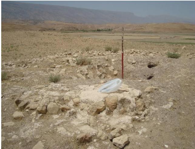
چهارطاقی مجموعه آثار کل سه پا درویشان