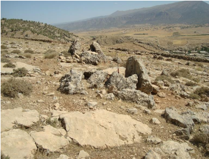
گورستان چشمه پهن شهرستان سیروان بهار ۸۷

۱۹۷۴) هلیان در بخش شمالی سیروان را مورد کاوش قرار داد و موفق به آثار دوره پارینه سنگی قدیم و نوسنگی گردید. پل باریک واقع در دره هلیان که در آن تعدادی تبر دستی کوچک در سطح زمین همراه با قطعات شکسته ادوات سنگی به دست آمده است نیز مربوط به اجتماعات این دوره هستند. هم چنین محل های باستانی دیگری مربوط به دوره پارینه سنگی میانه (مسترین) و جدید (زارزین) در منطقه «توسط هیئت باستان شناسی دانمارک به سرپرستی پدر مورتسن کشف شده است. در حقیقت، نوسنگی به معنای دورانی است که پایان آن استقرار کامل در روستاها و آغاز شهرنشینی بوده است (محمودیان، ۱۳۹۸: ۲۱).