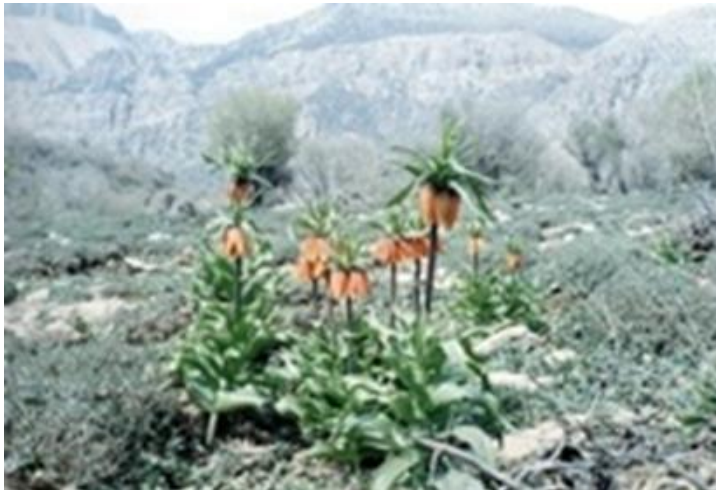
پوشش جنگلی و مرتعی کوهستانی منطقه

آباد و حاصلخیز هستند. سیروان به صورت دره‌ای نسبتاً وسیع بین دو رشته کوه «چرمین و لئه» از یک سو، و «مانشت و سیوان» از سوی دیگر، گسترده شده است که به وسیله رودخانه سیروان و چشمه‌سارهای جانبی آن آبیاری می‌شود. این منطقه از نظر توپوگرافی تپه ماهوری و زیرساخت طبیعی آن رسی - شنی است و به صورت دشتی آباد در محدوده رودخانه سیروان و ارتفاعات پیرامون دشت خودنمایی می‌کند. رودخانه‌های کارزان و سیروان و چشمه‌های دائمی آن منبع تأمین آب ساکنان این منطقه را تشکیل می‌دهد. فعالیت اقتصادی مردم، کشاورزی و دامپروری است. درختان بلوط پوشش جنگلی ارتفاعات غرب و جنوبی منطقه را تشکیل داده هرچند، گونه‌های ون، زالزالک و کیکم در ارتفاعات این شهرستان رویش دارند. ارتفاعات غربی شهرستان دارای پوشش جنگلی متراکم بلوط و از ذخیره گاه‌های مهم این گونه جنگلی در زاگرس غربی قلمداد می‌شود.