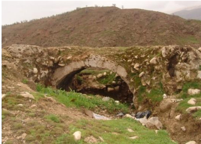
بقایای شهر سیروان

دومورگان می گوید: "من فکر می کنم در تپه و تل سیروان ... خرابه های شهری از عهد ساسانیان را باز یافته ام. وی علت اولیه تاسیس شهر سیروان را چشمه پُر آبی دانسته که در این محل جاری است و در اطراف این چشمه اولین بناها برپا شده اند و اکنون این چشمه