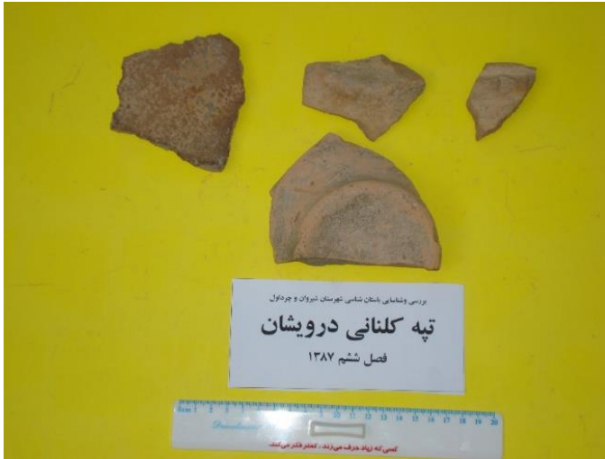
نمونه سفال‌ها و دیگر شواهد فرهنگی تپه کلنانی