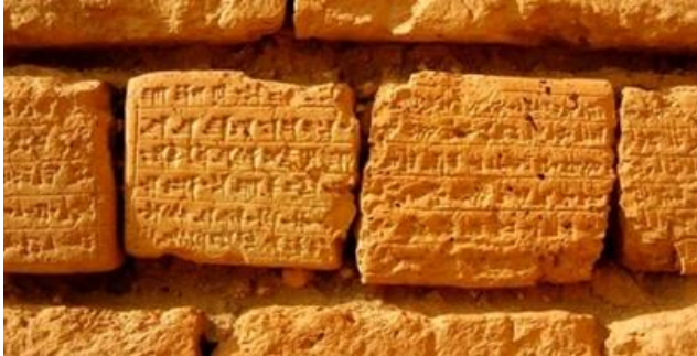
گل نوشته‌های بنای چغا زنبیل

زنبیل مربع شکل است. و طول هر ضلع ۱۰۲/۲ متر می‌باشد. نمای دیوارهای زیگورات از آجر ساخته شده و آجر نشسته‌های آن با خط ایلامی در ردیف‌های مختلف بر روی اثر مشاهده می‌شود. چغا زنبیل بخش‌های مختلفی چون معابد، حصارها، پلکان‌ها، پایه‌ی مجسمه‌ها، سیستم‌های فاضلاب و.. دارد.