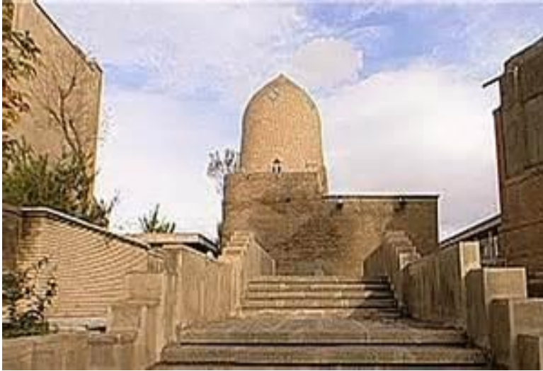
آرامگاه استر و مردخای در شهر همدان

آرامگاه نوشته شده است. مصالح ساختمانی بنای این مقبره از سنگ و آجر است که به سبک بناهای اسلامی ساخته شده است.