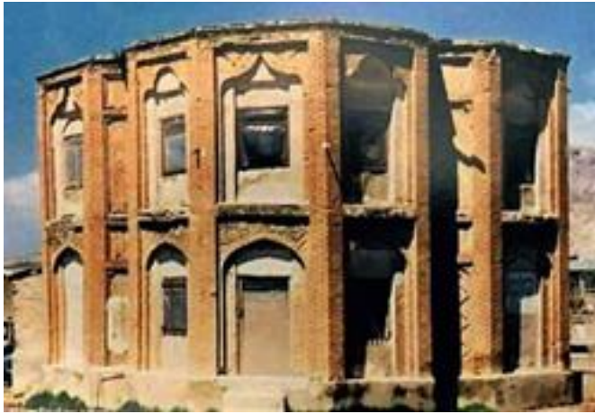
ساختمان قشونخانه در شهر ایلام