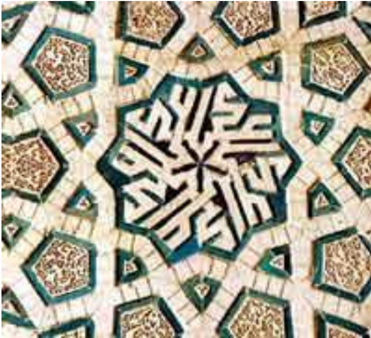
نمونه تزئینات آجر کاری در آثار ایرانی