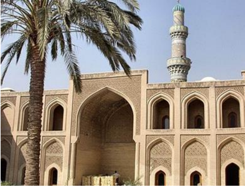
مدرسه ی نظامیه ی بغداد ( مستنصریه )

ی همکف که دارای نقش تغییر شکل یافته ای از طرح چهار ایوانی است و هم طبقات فوقانی به ترتیب براساس شبکه ده گام و سی گام بیزانسی بنا نهاده شده است ( یک گام بیزانس معادل ۳۱/۲۳ cm است ).