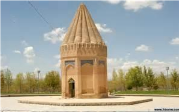
بقعه‌ی متبرکه حقیوق نبی در شهر توسیرکان