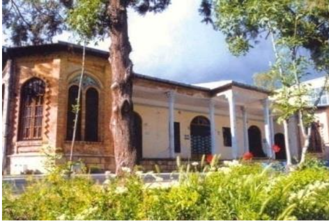
عمارت باغ ایرانی فلاحتی ایلام

قلعه ژاندارمیری (قشونخانه): این بنا که در ضلع جنوبی میدان ۲۲ بهمن ایلام قرار داشت، از دوره قاجاریه برجای مانده بود. بنای مذکور به عنوان مقر نظامی شهر ایلام از مصالح سنگ و گچ و در دو طبقه ساخته شده بود. متأسفانه این اثر تاریخی که به عنوان یک دژ نظامی در بخش مرکزی شهر ایلام خودنمایی می‌کرد در دوره حکومت پهلوی کاملاً تخریب گردید.