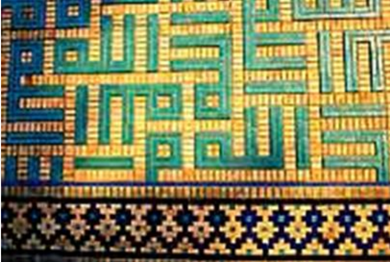
نمونه تزیینات آجر کاری

چسبانده‌اند (محمودیان، ۱۳۹۳: ۵۹). در بنای مسجد گوهر شاد و مسجد کبود تبریز از این سبک استفاده شده است