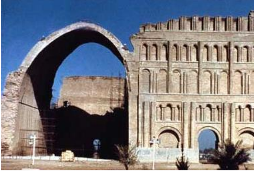
بخشی از ایوان مدائن دوره‌ی ساسانی - جنوب بغداد

و مسیرهای داخل صحن برخی از مسجدها، آجرها را بصورت 'تره' و به شیوه خفته و راسته در طرح‌های مختلف بکار می‌برند تا مقاومت بیشتری داشته باشند.