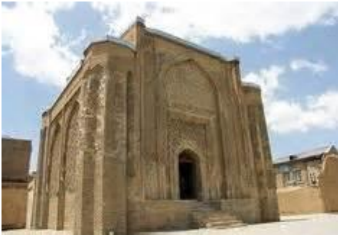
برج علویان همدان

برج علویان: برج و مسجد علویان که از شاهکارهای هنر معماری و تزئیناتی اسلامی است در داخل شهر همدان ساخته شده است. این بنا منسوب به دوره سلجوقیان است و سازمان میراث فرهنگی کشور از آن محافظت می‌کند. تزئینات نمای آجری و گچبری‌های بسیار زیبا در قالب تصاویر و نوشته‌ها، عظمت هنر معماری اسلامی را در این بنا نشان می‌دهد.