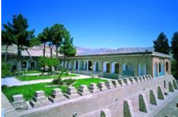
قلعه والی ایلام

سه ورودی در سه ضلع دارد که ورودی اصلی به شیوه هشتی منظم با طاق و دور چین آجری است. سقف کلیه اتاق‌ها از ملات گچ و آجر است. در آن‌ها از انواع و اقسام قوس‌های باربر و غیر باربر (تزیینی) به شیوه رومی استفاده شده است و اطراف آن‌ها را با شکستگی و برجسته نمودن آجرها و همراه با کاشی‌های ریز رنگی تزیین کرده‌اند.